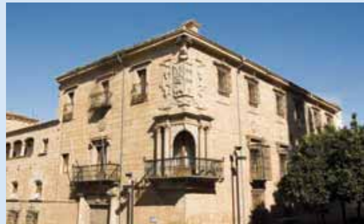
Palacio de los Marqueses de Mirabel