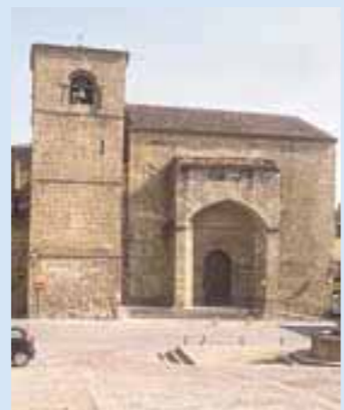
Iglesia de San Nicolás

Con un bello ábside románico y una bella imagen de Cristo del s. XV.