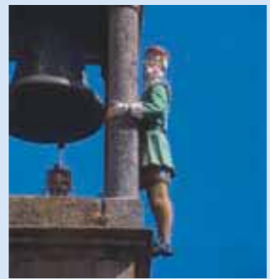
"El Abuelo Mayorga"

Edificado en el s. XVI con estilo de transición del gótico al renacimiento y presidiendo la Plaza Mayor, podemos ver al magnífico Palacio Municipal, con una doble arcada renacentista en su fachada y en su costado izquierdo un escudo de Carlos V. Sobre la torre campanario se observa el abuelo Mayorga, que da las horas a la población, popular personaje de la ciudad. Fiel reflejo de lo que fue antaño y en torno a la cual, aún hoy día, se mue-