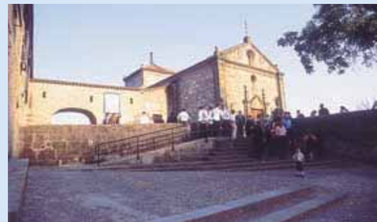
Santuario de Ntra. Señora del Puerto

Obra de Juan de Flandes fue construido a mediados del s. XVI y se realizó para así poder traer agua a la ciudad desde el final del otro acueducto anterior, conocido popularmente como "cañería de los moros". ■ SANTUARIO DE STA. MARÍA DEL PUERTO En plena Dehesa de Valcorchero a unos 5 kms. de la ciudad, se encuentra este paraje de gran belleza, desde el que se contemplan magníficas panorámicas de Plasencia y alrededores. En Este Santuario se venera a la Patrona de Plasencia, la Virgen del Puerto.