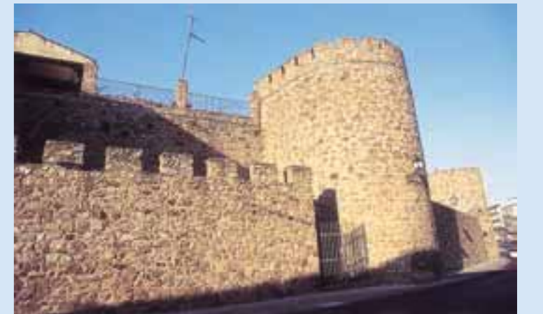
Muralla de la ciudad