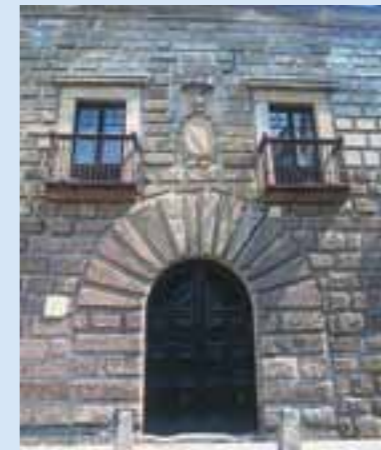
Palacio de Carvajal-Girón

crucero cubierto de bóveda de crucería, destacan en su nave central el sorprendente y bello Retablo Mayor, obra del s. XVII, con lienzos de Mateo Gallardo y Luis Fernández o Ricci y esculturas de Gregorio Fernández, sobresaliendo su Grupo de la Asunción y fechadas en 1664. En este retablo guarda un lugar especial la imagen en madera del s. XIII, la Virgen del Sagrario. Magnífica la atractiva portada plateresca, con influencia florentina, de la entrada a la Sacristía. Junto al Altar Mayor destaca el sepulcro renacentista del Obispo Pedro Ponce de