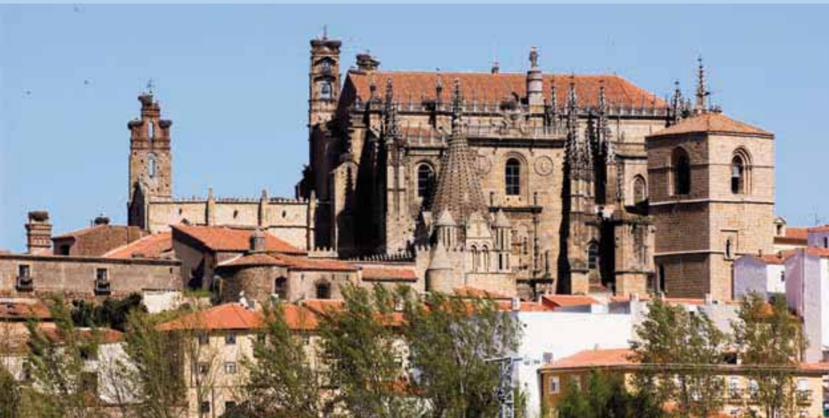
Vista panorámica de la catedral de Plasencia

do entre sus tradiciones medievales, atractivas ferias y fiestas y singulares mercados como el que se celebra a principios del mes de agosto con el nombre de Martes Mayor, declarado Fiesta de Interés Turístico Regional. Referente económico y socio-cultural para esta zona septentrional de la región extremeña, fruto sin duda alguna de la cordialidad y el espíritu emprendedor de su población, Plasencia se ha ido dotando de excelentes servicios, que han hecho de la misma el más importante núcleo urbano del norte de Extremadura.