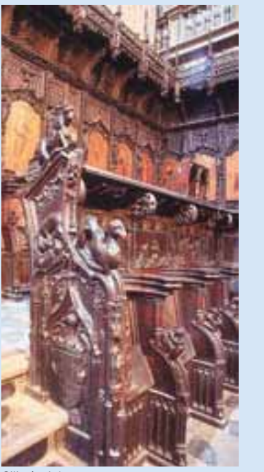
Sillería del coro

Obra del artista gallego Juan Bautista Celma, quien la concluyó en 1606, guarda al coro una hermosa Reja.