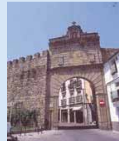
Puerta del Sol

En ella se sitúa la Ermita de la Salud, que aún conserva de la antigua puerta su bóveda de cañón y el escudo de los Reyes Católicos, conocido popularmente como el "Cañón de la Salud".