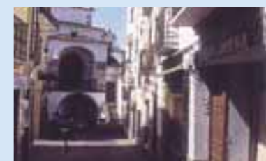
Ermita de la Salud

Situada en la calle del Rey, de esta casa salió el cortejo de Juana la Beltraneja para casarse con el rey portugués Alfonso V en 1475. En esta misma calle se encuentran la Casa de los Trejo Barrantes del s. XVI y el Palacio de los Trejo y Vargas.