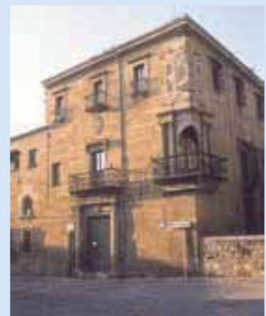
Casa del Deán