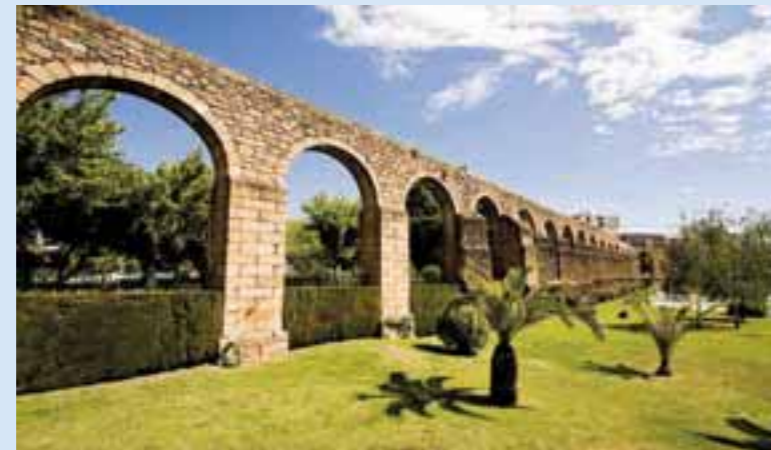
Acueducto de San Antón